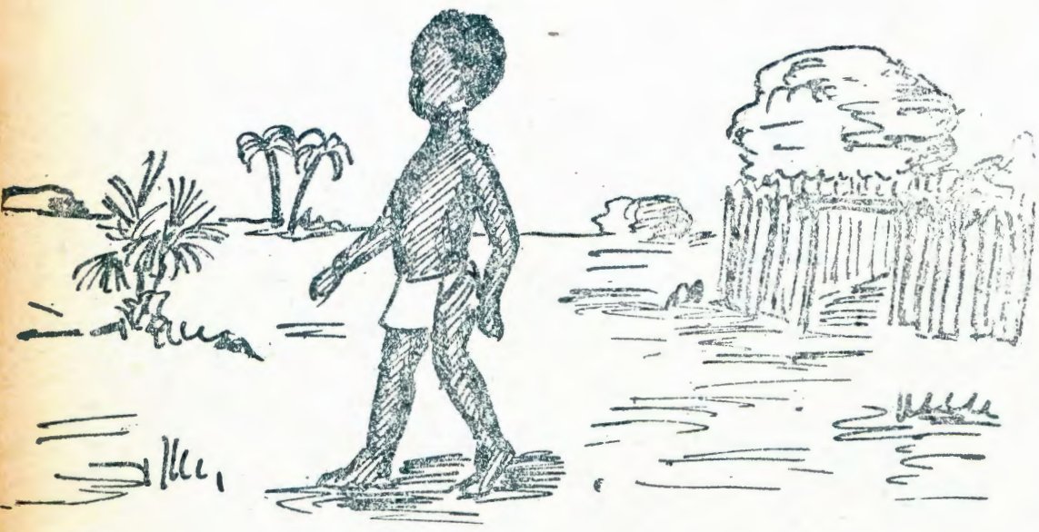
EGUMBO LJANDJE OLJO UUA UANDJE.

„Egumbo llandje oljo uua uandje,“ osho aantu haa ti.