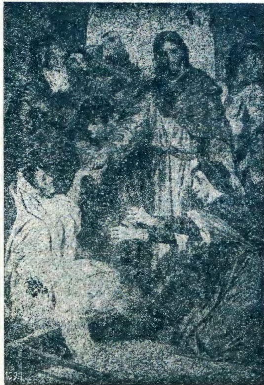
EIMBILO LJEHANGANO 414

Kalunga okwa pe aantu ompango ye, opo aantu ya Kalunga ya tseye okuyanda uuwinayi auhe. Mokokonakona iipango omulongo ya Kalunga otatu dhimbulula, nkene oyo ayihe tayi lalakanene ohoole. Ihe ohoole kayi shi owala oshilalakanenwa shompango, oyo wo ekota lyompango. Kalunga okwe tu hololele ohoole ye yoku tu hoola. Ohoole ye ndjoka otayi pendutha wo mutse ehala ewanawa, tu kale noku mu tila noku mu hoola komeho ga shaa shoka, tse tu mu longele nenyanyu. Otse ngele tu mu hoole ngaaka, otu hoole wo edhina lye eyapuki noohapu dhe oondjapuki. Opo tuu mpoka pe negwanitho lyoshipango oshitiyaali nolya shoka oshititatu. Ishewe ngoka e hoole Kalunga, oye e hoole wo omagano ngoka oye e ge tu pe, ngashi tangotango oye e hoole aakuluntu mboka e ya pewa ku Kalunga. Omuntu onakuhoola Kalunga e nokukala wo e hoole omuntu omukwawo, ye kee mu ningile uuwinayi wa sha, ngele wokolutu nenge wokomwenyo. Unene e nokuhoola omunandjokana naye ngoka e mu pewa ku Kalunga. Omuntu ngo-