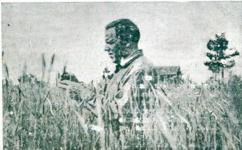
Oshilja sha mene tuu?

Evangeli lja ciki no kutse uo, no lja fa lja taambua uo kojendji. Ihe aalanduli ja Jesus shili oje li po jangapi? „Nkoka ndi li nomuntu guandje oko ta ka kala” Mboka haa landula Onzigona shaa mpoka ta ji oje li peni? Kaje shi ojendji, oja pumba. Hatse tuu mboka tu hoole omuenjo, tua tila omasheko nomahepeko nokudinua? Jesus ta ti omuntu kuatjangeji ta kanica po omuenjo gue. Nokukalamuenjo kue kaku nejambeko, inaku iima sha. Omukriste ngiika te shi kuminua. Oshiholekua shejambeko