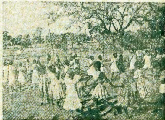
Menongelo omu na uo omanjanju ogendji.