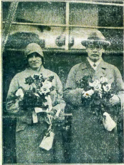
Meme Lindstrom sho kue ja luotango pamue nomusamane Vapaavuori.

Enjanju ljoje olinipo ino hala oku li holeka kookuume koje jo mOuambo?