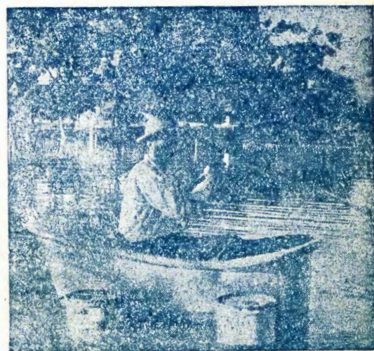
Momulonga gwokOshigambo mwa li mu nomeya omumvo 1952.