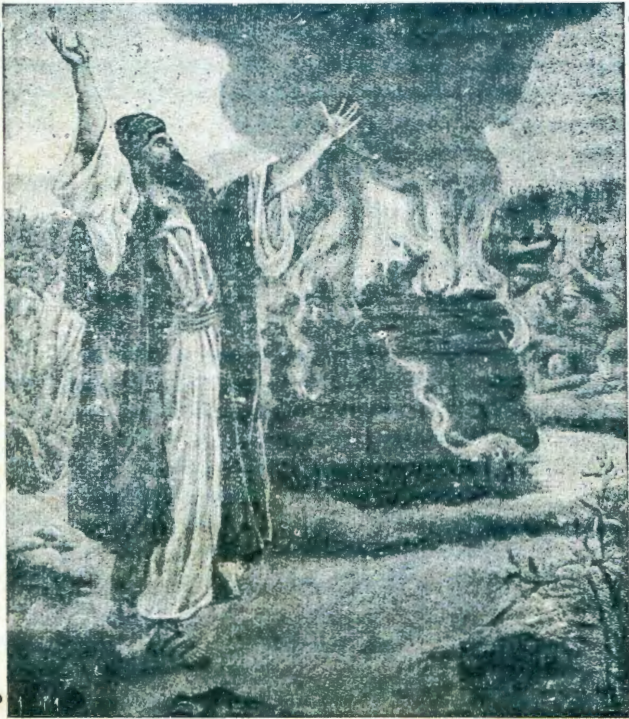
OMUPROFETI ELIA KONDUNDU JA KARMEL.