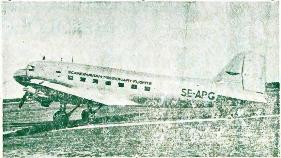
OMUMVO 1945 OMAHANGANOTU-MO GAMUE OMAKUALUTERI OGA HANGANA NOGI ILANDELE ODILA NDJIKA JE ENDICA UO AATUMUA AASUOMI.