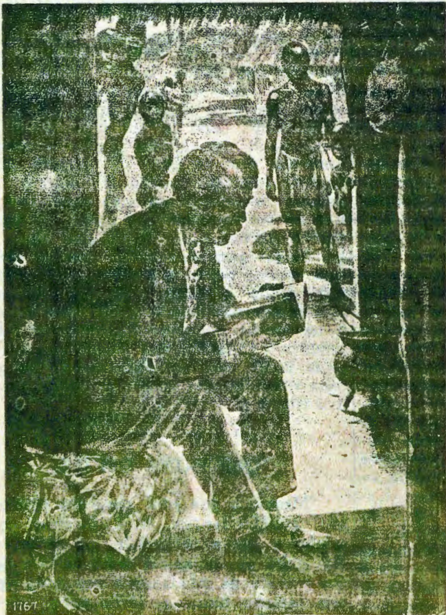
Omuhongi David Livingstone ta lesha Ombibeli.

Tu kuaca mokukala, tse tu di guanice. Megulu ljoj' lj' oopala ngoj' u tu cikice.