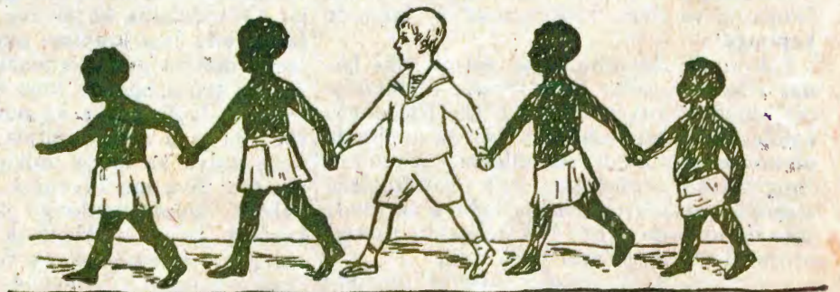
TATU KI ILANDELA OMBIBELI.