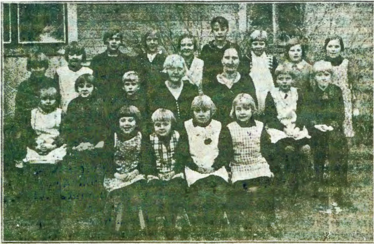
LUNONA TAU KONDJELE OSHILONGA SHOMUUA

Efano ljauo to li mono mpaka. Ojo jomoshilando sha Pöri. Edina ljongundu TOIVONTAHTI tali ti: onjoci jetegameno. Ojo je netegameno nojo uo nando aashona ja uape okulongela Omuaa Jesus nokukuaca oshilonga she shetumo. Etegameno ljauo inali kala osima. Taa gongala lumue moshuuke mokuhondjela etumo. Taa tungu uo uunima ui ili no ui ili, ngashi uumbamba uushushu. Miigongi jauo taa galikana, taa lesa oohapu da Kalunga nomahokololo omauanaua e taa imbi omambilo gaanona. Lumue momuvo kehe taa hiji aakuluntu jauo naantu jalue uo je je okulanda uulonga uauo. Oshikumici shili,