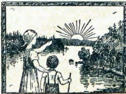
OMUNJANJANGIDI A SHUNA KU SUOMI.

Omukuetu ta halele ajehe mbaka eja mbeko lja Kalunga, Oje e ja longice uo pahalo lje ljopahoole je.