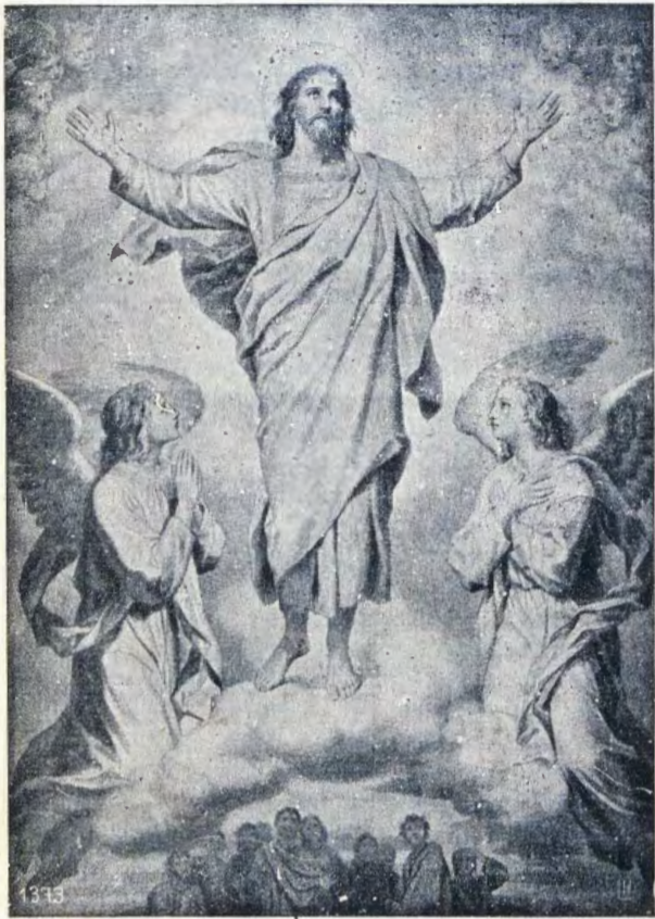
OSHIKONGO SHEGULU SHA FA ONSHENO JOSINAPI.

Etameko, ljeitaalo ljopakriste olja li eshona shili. Momukunda gumue guokokule mua holoka omulumentu kua popi a ti ta ka dika oshilongo sha Kalunga kombanda jevi. Oje kua li ohepele no ina hala okuitsejica unene naalanduli je ja li aashona noohepele ngashika je muene no inaa longua. Omulumentu ngoka ina kongga aanamadina aue, okua tsilacana ondumbo najo. Ina lalakanena esimano no ngashi ina kongga ekuaco kaantu. Mbalambala ta ka hepekua kaantu mboka je noonkondo doku shi ninga, no ta kuatua e ta dipagua ihe. Ongundu je onshona oja halakana. Je ine ja pa omauuco nkene je nokulonga ando.