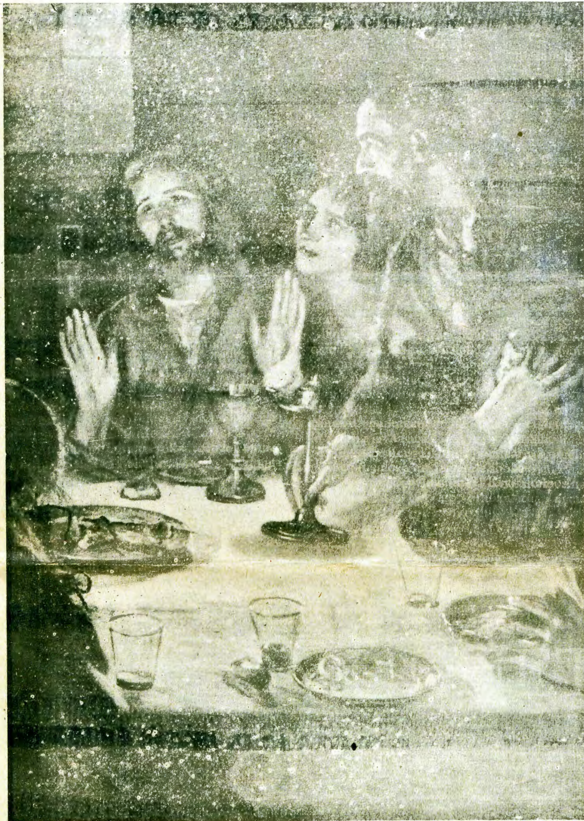
EUUVICO LJOPASSA EKULU.

Euvico ndika olju uvicua ku Johannes Krysostomos. Oje okua li omubisofi mu Konstantinopol pecimbo ljomimvo 350 - 400. Okua kondjica shili omikalo omiunaji niihupe juupagani nokua kuaca oohepele nojo ja gongalele puje noongundu oonene. Aantu sho ja hokua okupulakena omauvico ge oje mu luku „Okana koshingoli.”