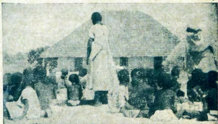
Ounona tava longua kEngela

Oje šo kua huliša oseminaari, okua tuminua kooha žOngandjela, okEtiljasa. Oko a tamekele iilonga je. Egumbo lje okue li tungu mezina lja Kalunga. Kalunga nokue mü jambeke. Egumbo lje okue li tungu enene li nongulu jomala gatatu, nepja lje kue li longo naua nokua hupu omišima ošminene ndatu. Egumbo lje lja ningi ejakuš li ljoombinga mbali: aasindjala jolutu oja kuašua, nuunene aakuanaluhepo jokomueño ju ulukilua komühupiši guoomueño. Ihe šo a kala ngeji a kola, omuene guomükunda okue mü sile efupa, a hala e mü tize po nokue ju umbu ondjembo. Omükulukazi gue a ti: "Aanona naa je kongulu, opo ja hupe po, pamue otaa žipagua ngele je li mpaka." (taži tsikilua)